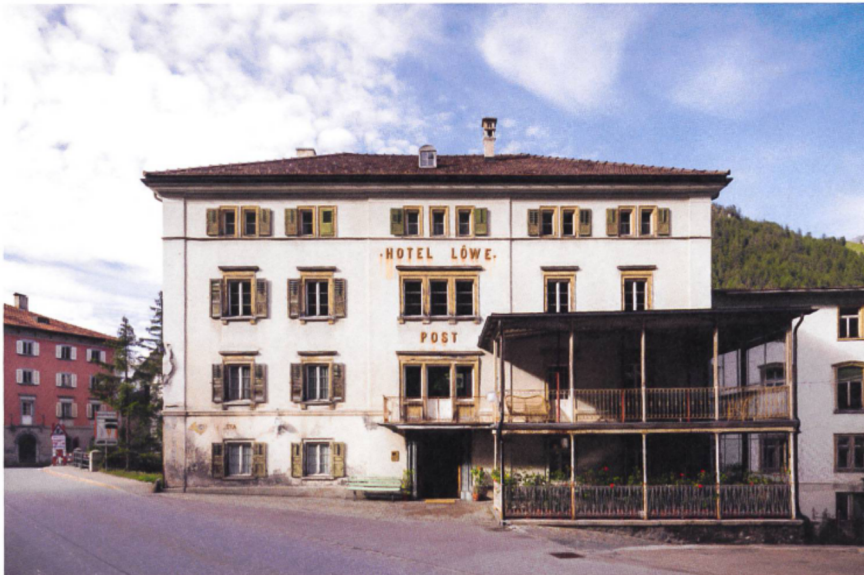
Das Post Hotel Löwen in Mulegns: Logie für Adel und Betuchte.