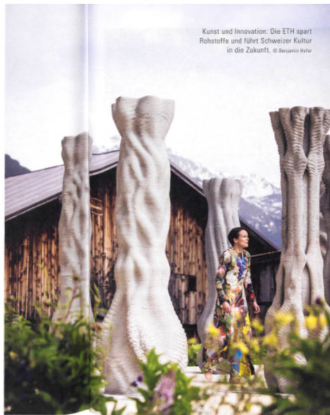
Kunst und Innovation: Die ETH spart Rohstoffe und führt Schweizer Kultur in die Zukunft.