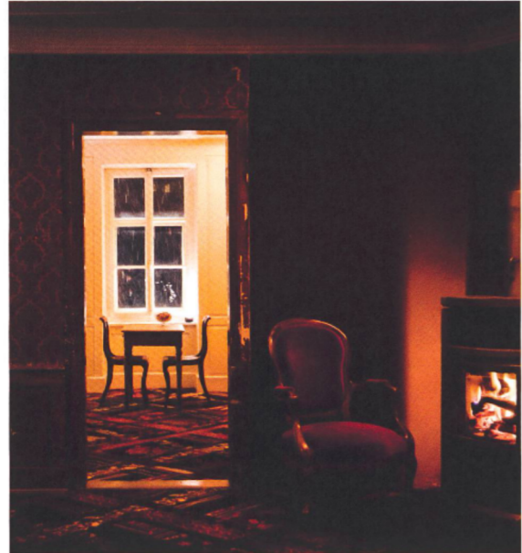
Auch innen ungewöhnlich luxuriös.