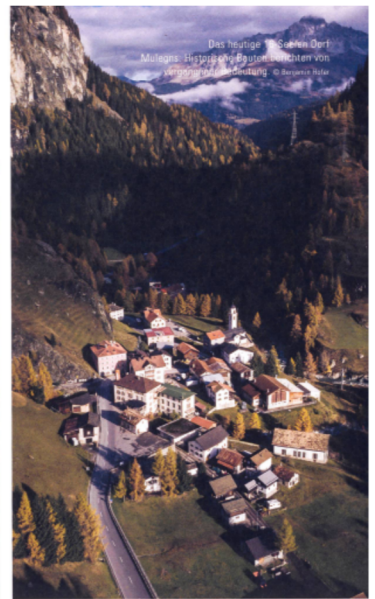
Das heutige Mulegns: Historische Bauten zeichnen von der Seele die Identität. © Benjamin Huber