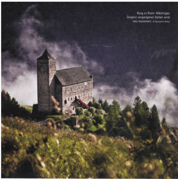
Burg zu Riom: Mächtiges Zeugnis vergangener Zeiten wird neu inszeniert.