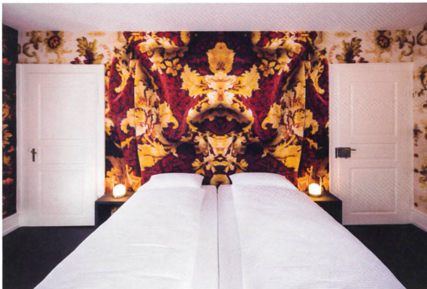
Die Innenräume mit altem Mobiliar erscheinen in neuem Gewand.