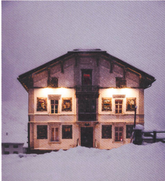
Der in Paris reich gewordene Zuckerbäcker Lurintg Maria Carisch erbaut 1856 eine prächtige Villa im Nirgendwo.