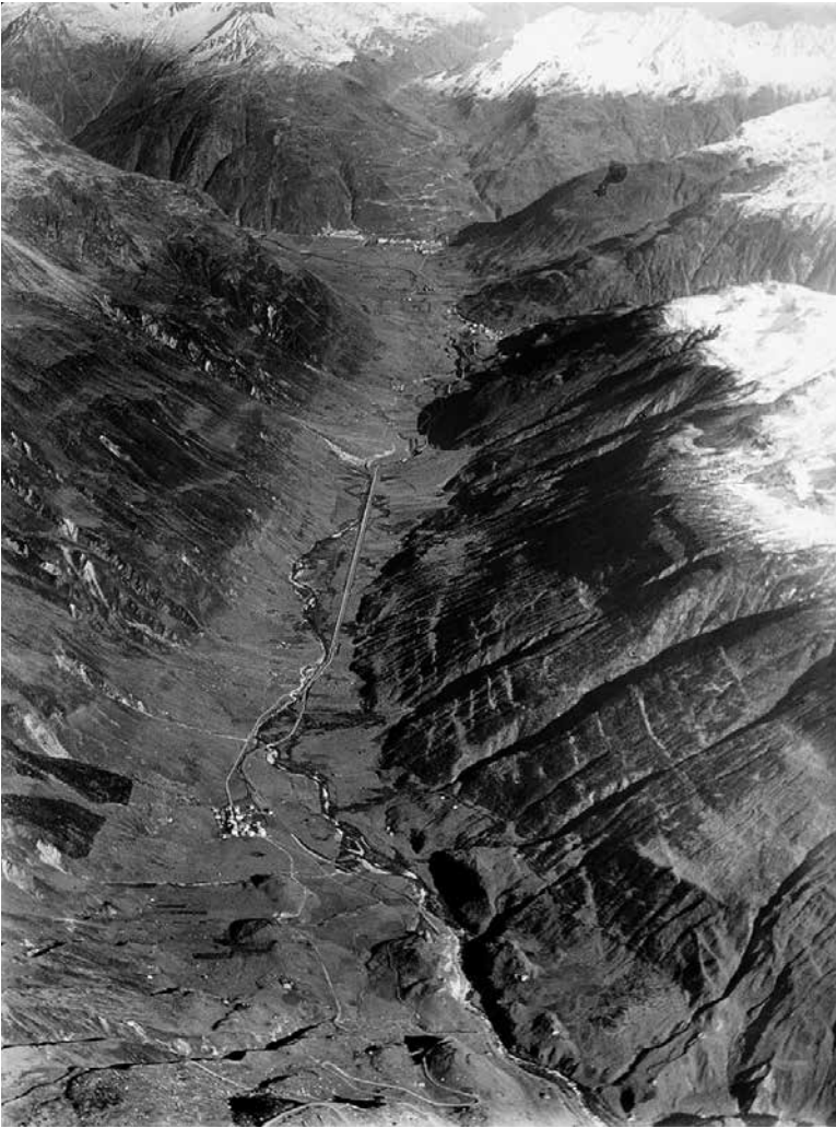
Das Staudammprojekt im Urserental hätte noch grössere Dimensionen angenommen als im Rheinwald. Sämtliche Siedlungen von Realp bis Andermatt wären geflutet worden. Aufnahme um 1930.

worden sei. 11 Seine Argumente für die Begleitung des Projekts im Urserental waren dieselben wie gut ein Jahr zuvor im Rheinwald: Es sei für den Heimatschutz sinnvoller, einen Architekten aus seiner Mitte beim Projekt dabeizuhaben, als abseits zu stehen. Sollte das Werk wirklich einmal in die Tat umgesetzt werden, garantiere dies zumindest die architektonische Qualität der massiven Eingriffe in der Landschaft.