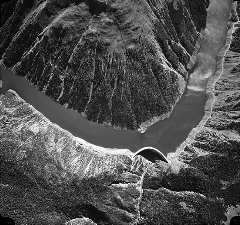
Der Lago di Livigno bei seiner Fertigstellung 1969. Der grösste Teil des Wassers wurde auf italienischem Boden – also ausserhalb des Schweizerischen Nationalparks – gefasst.

betreiben, dass es den Weiterbestand des Nationalparks nicht verunmöglicht. In seiner heutigen Fassung ist das Projekt für den Heimatschutz allerdings unannehmbar. Es müssen von den Bewerbern weitere namhafte Zugeständnisse gemacht werden. Lässt sich hierüber mit den Bewerbern eine Verständigung erzielen [...], so wird der Schweizer Heimatschutz auf eine grundsätzliche Einsprache gegen das Werk verzichten und seine Fachleute zur Verfügung stellen, um einem möglichst schonenden und architektonisch befriedigenden Bau das Seine beizutragen.» 14