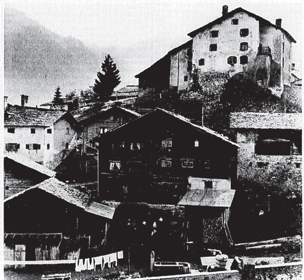
Ausschnitt des Wohnhügels von Splügen.

Gareida di Sotto, San Carlo-Fornas, die Ueberbauung im Ortskern sind nur drei Beispiele, die ahnen lassen, daß der neue Planungsmechanismus, dem sich die Gemeinde für San Bernardino verschrieben hat, nicht besser ist als das alte. Aber vielleicht wird man den Misoxern, die ihre Wälder durchlöchern wollen wie ein Stück Käse, am gerechtesten, wenn man sich überlegt, daß der Waldboden der einzige «Ueberfluß» ist, den die Entföderung haben. Trotz der N 13, die die Entföderung im Nahverkehr auf ein paar Fahrminuten zusammenschürzen läßt, schädigt die Ueberlegung nicht an, daß heute, im Gegensatz zu früher, durchaus eine Standortalternative für die